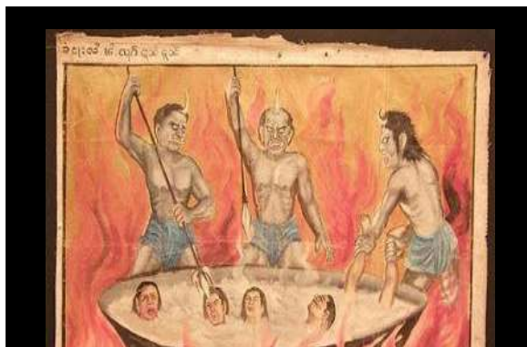
Энэ бол Библийн дагуух төсөөлөл биш ээ!

Сонирхолтой нь, бусад шашин бүгд тамын тухай сургаал номлолтой. Энэ сургаал нь аргагүйн эрхээр “үхэшгүй сэтгэл”-ийн сургаалтай нь холбоотой. Эрүүл ухаантай хүний санаанд ормооргүй дэндүү аймаар олон янзын тамын дүрслэлийг шашинлаг хүмүүс гаргасан. Энд ганц тийм харгис хэрцгий төсөөлөл үзүүлсэн зургыг тавьлаа.